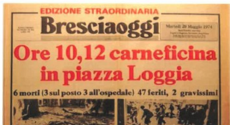
BRESCIA - PIAZZA DELLA LOGGIA - 28 MAGGIO 1974

15 novembre 2019 alle ore 10,00 CGIL MANTOVA - Sala Motta Via Altobelli 5